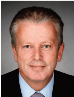
Dr. Reinhold Mitterlehner Bundesminister für Wirtschaft, Familie und Jugend

Der internationale Wettbewerb der Destinationen wird immer intensiver, die Erwartungen unserer Gäste an den Tourismus-Standort Österreich steigen. Daher müssen wir neben unseren Produkten auch unsere weltweit anerkannte Servicequalität laufend optimieren. Umso wichtiger sind vorbildlich wirtschaftende Unternehmen, die nicht nur die Qualität ihres Angebots hoch halten, sondern auch den Arbeitsplatz Tourismus attraktiver machen und die Mitarbeiterzufriedenheit nachhaltig erhöhen. Denn motivierte, engagierte und professionelle Beschäftigte leisten einen entscheidenden Beitrag zur Wettbewerbsfähigkeit der österreichischen Tourismuswirtschaft.